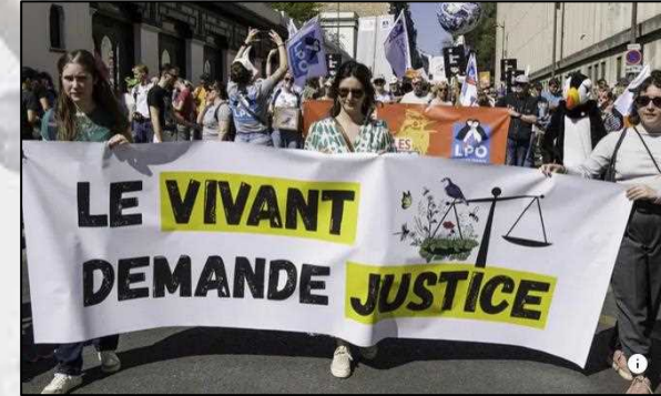
Manifestation des ONG de défense de l'environnement à l'origine de la condamnation de l'Etat dans l'affaire dite "Justice pour le Vivant", le 5 avril 2025